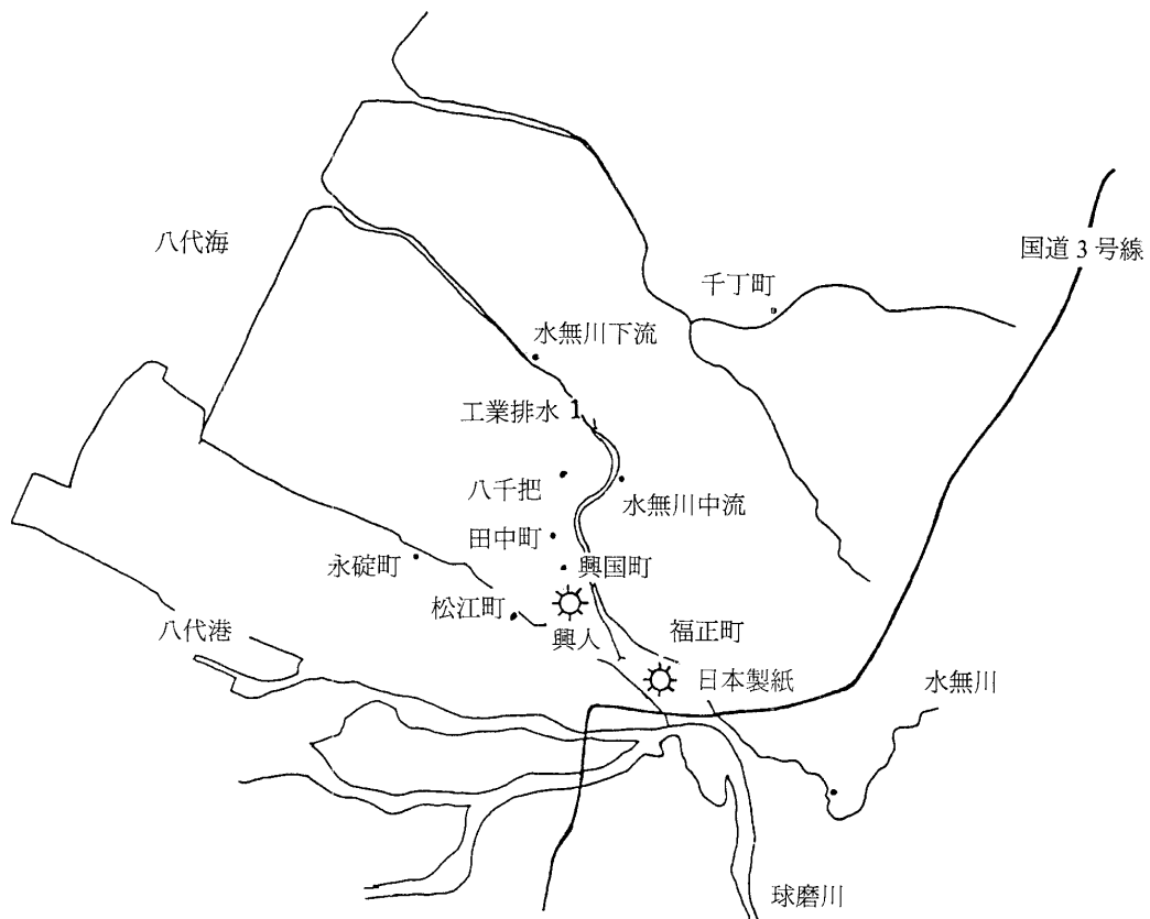
図2 河川水の採水地点一覧 — 八代市内 —