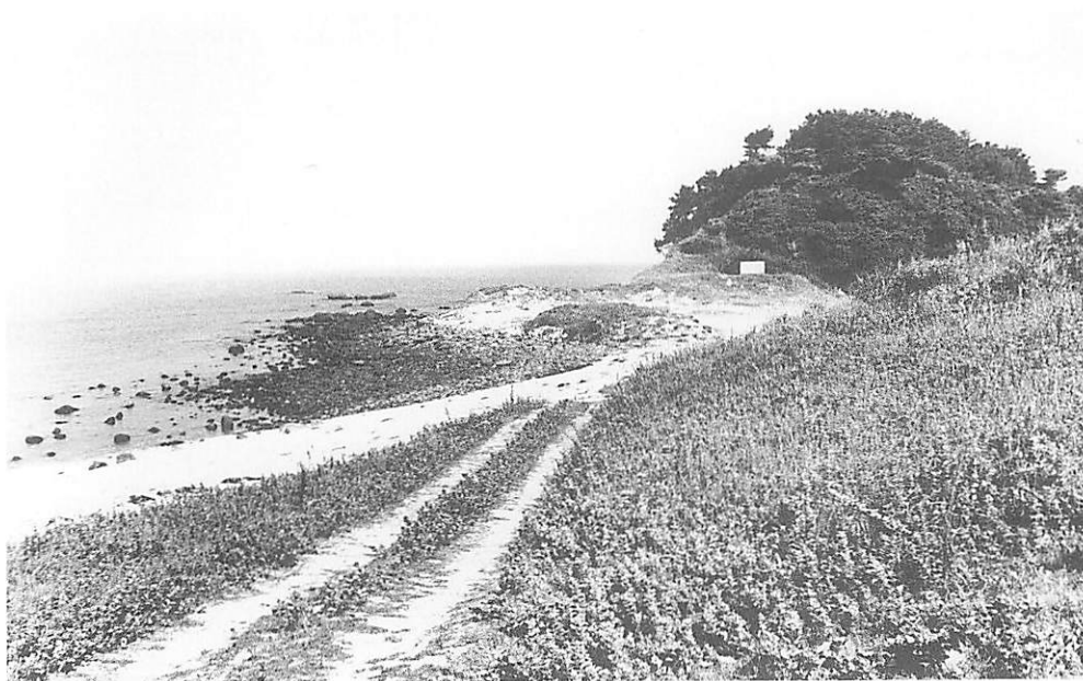
大久保貝塚近景（西より）