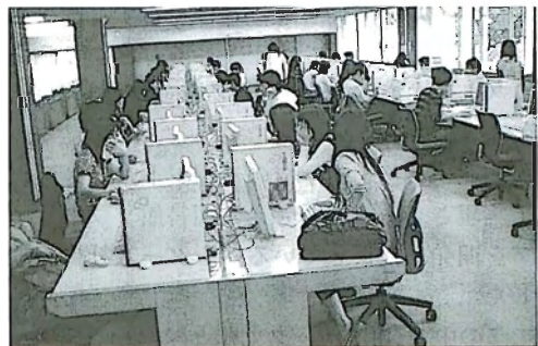
図3：熊本大学附属図書館内のPCコーナー

図書館に設置しているPCはこの中でも非常に利用率が高く、平成19年度、図書館のプリンタから46万枚/年の出力があった（図3）。