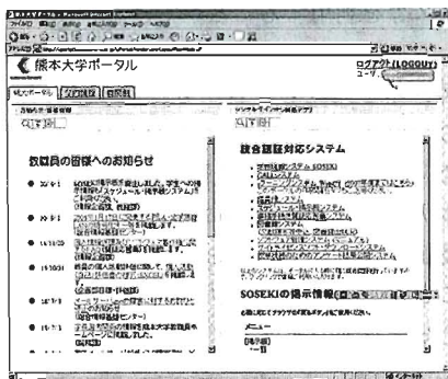
図2：熊本大学ポータル画面

平成20年5月現在、熊本大学ポータル上でCAS認証に対応したシステムとして次のものがある。CMSとしてWebCT、学務情報としてSOSEKI、CALL、スケジュール・掲示板システム、事務情報手続き質疑応答システム、就職支援情報（学生の場合）、ソフトウェア管理システム、サイトライセンスソフト・ダウンロードシステム、授業改善のための結果公開システム、そして図書館システムである（図2）。