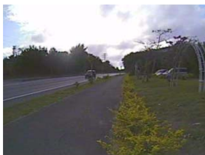
図 2 センサーが通行車両に反応して得られた画像

実験開始から終了までの間、通過した車両は双方合わせて 100 台ほどとなった。記録された画像を検証したところ、車両感知センサーをトリガーとして記録された画像には、センサーに反応した車両が確実に画像として捕らえられていることが確認できた。それとは対照的に、画像の変化をトリガーとして記録された画像には、対向車線の車両や風に揺れる木の枝に反応して記録されたものやビデオカメラの正面から写りこむ太陽の光や雲の動きに反応してしまった画像が多くみられた。(図 2~5)