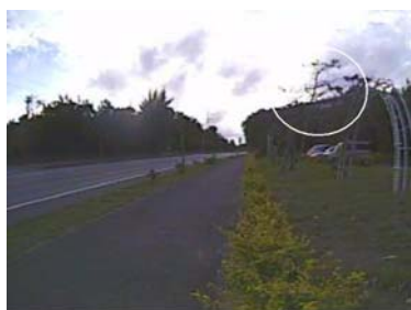
図 4 木の枝のゆれに反応して得られた画像