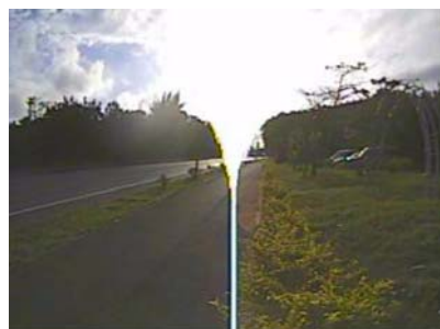
図 5 太陽光に反応して得られた画像

各トリガーにて、通行車両を正確に感知したことを「正感知」、対向車線の車両や太陽の光などを感知したことを「誤感知」として録画された画像の検証を行ったところ、画像の変化をトリガーとした場合の正感知率は、18%であったのに対し、ロードキル回避システムの車両感知センサーをトリガーとした場合の正感知率は、93% と非常に高く、ファイル数ならびにメモリーの使用容量も 3 分の 1 程度となることが明らかとなった。以上の結果から、自動録画装置をロードキル回避システムの車両感知センサーと連動させることにより、目的とする画像を効率よく録画できることが明らかとなった。本実験を経て、ヤンバルクイナの繁殖時期などにあわせてロードキル回避システムの設置をすることが決まっており、さらに検証実験を試みる予定である。