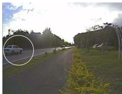
図 3 対向車線の車両に反応して得られた画像