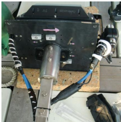
写真-1 センサー連結部