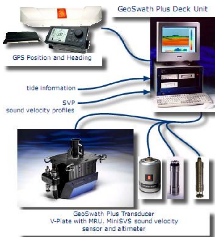
図-1 サイドスキャンソナーのシステム概要