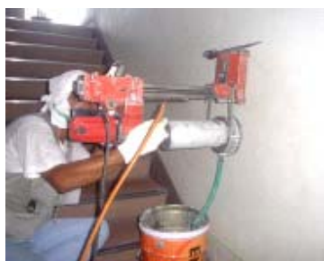
コア供試体の抜き取り

このように，コンクリート・コアの減少に伴う採算等の問題も浮上し，約8年間続いたコア圧縮強度試験を終えることになった。長い間，お手伝いいただいたメンバーの皆様にご心より感謝申し上げます。