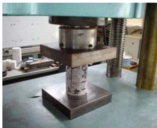
コア圧縮試験状況