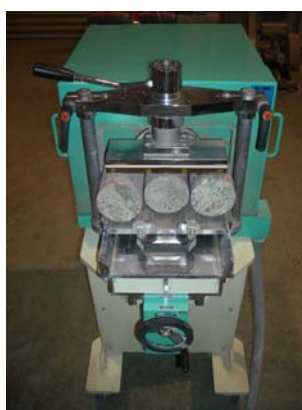
コア供試体の端面仕上げ