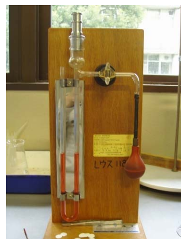
粉末度（ブレン）試験