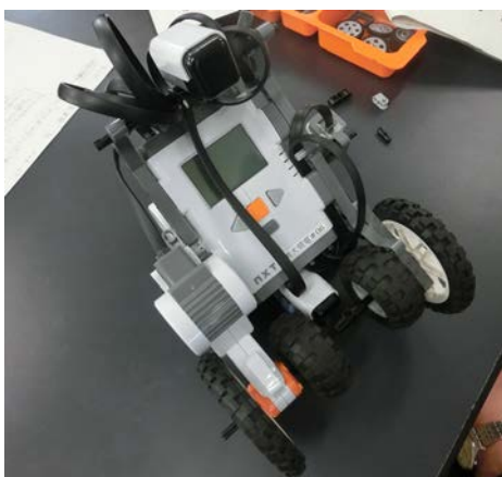
図 1 : サッカーマシンの例

我々は主にプレゼン時の質疑による指導、サッカーロボット・プログラミングの指導、環境整備・機材準備、TA の指導など実習がスムーズに行われるよう支援した。