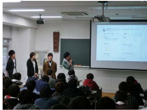
図5：プレゼンの様子