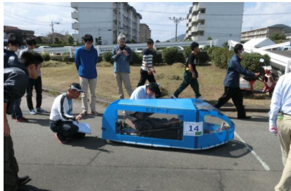
図 2. 熊大ソーラーカーチームとエコ電カー