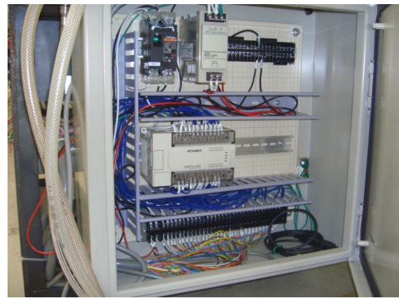
図 3. 制御系系統図と作製した制御盤