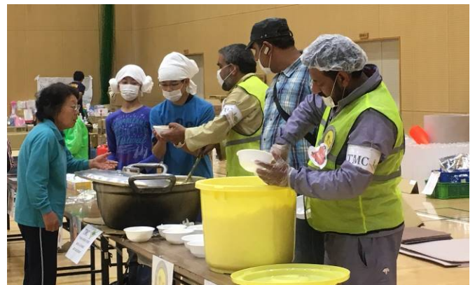
図5 イスラム教の団体からカレーの支援をいただく (配膳を手伝う中学生避難者左から2・3人目)

言葉の問題や食事のことなど、課題は尽きないが困ったことばかりではない。イスラム教の団体を通じてハラールカレーがふるまわれたときには、暖かい食べ物への感謝と日頃なじみのない味に会話も弾んだ。避難所の子供たちは、率先して配膳の手伝いをしてくれた(図5)。避難者の方々は、言葉に躊躇することなく「ありがとう」と声をかけて受け取っている姿が印象的であった。