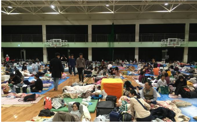
図1 熊本大学黒髪体育館の様子(4月16日)

避難所運営を解散するまで、学生がシフトを組んで対応に当たった。4月18日正午以降は、体育館に避難している避難者に運営への協力を呼びかけ、4月19日からは毎朝8時になるとボランティア募集のアナウンスを館内放送で流し、運営に参加してもらった。