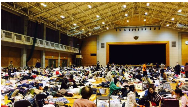
図2 隣接する県立高校体育館の様子(4月16日)