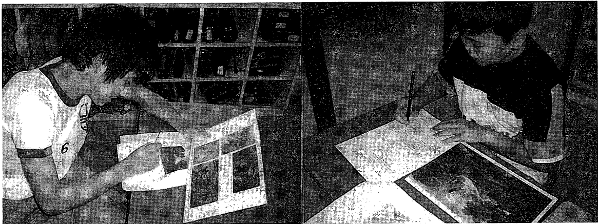
図2 ワークシートに記入する