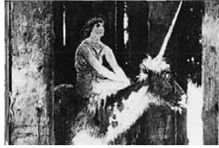
図2 ベックリンの「森の沈黙」