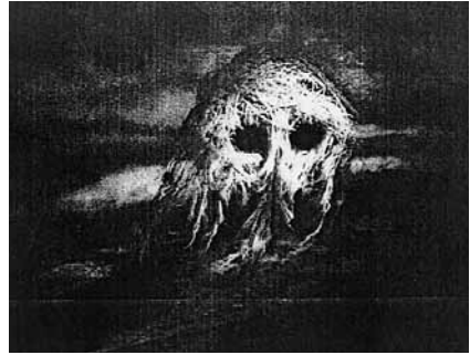
図5 髑髏に変わる洞窟

クリームヒルトがエッツェル王の城に到着した時は、初め捕虜のように見える。城の中も乱雑で汚れている。しかし徐々に城は清潔に秩序あるものになっていく。クリームヒルトのフン族への教化のお陰のようである。ただ、ヴォルムスの階段は広く整然と作られているが、フン族の階段は曲がりくねり、作りは稚拙である。