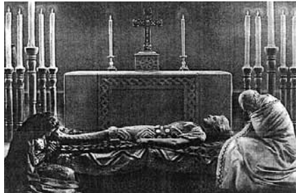
図6 棺の上のジークフリート

すでに1917年に『大戦とドイツの心—われらの民族の内面生活から』というタイトルの本のなかで、次のように述べられている 14) 。「森をぬけ、灰色の北国から色鮮やかな南へと、ゴシックのドームで祈るが、一方で無敵の剣を研ぐ光の英雄、親密にして悪意もなく信頼できる誠実な友、これこそ真にゲルマン的な精神である。しかしジークフリートには敵があった。ハーゲンである。」そして、裏切り者であるハーゲンの性格付けについてこう締めくくられている。「ジークフリートのように悪意のないドイツが兄弟国イギリスに襲われたのだ。」神話の根本モチーフである裏切りと光の形姿の殺害は、昔から多くの解釈にゆだねられてきた。しかし戦争の体験は、ニーベルンゲンの歌や数々の小説それに戯曲にも現われ、映画上映のすぐ後にユルゲン・フェーリング演出による6時間に及ぶヘッベルの『ニーベルンゲン』三部作を上演させることになった。