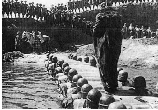
図7 兵士の作る浮橋を歩むブルンヒルト

面が多くなる。クリームヒルトがエツツェル王の息子を生んだことを聞いて、草原を疾駆して彼女の元に戻るフン族の馬上の場面はきわめて動的である。火災や殺戮が45分も続く最後の戦闘場面も大衆の装飾では説明できない躍動感にあふれている。