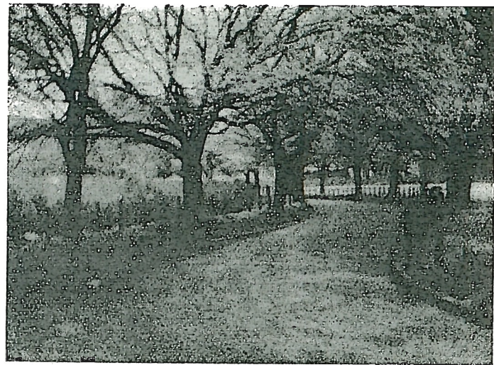
櫻花爛漫たる正門内