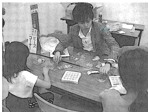
写真4 ビーズコーナー