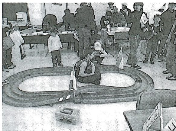
写真1 ミニ四駆コーナー

今回、夢科学が同時開催のため、化血研賞の対象となり、優良賞をいただいた。学生の皆さんお疲れ様でした。また、来年もがんばりましょう。