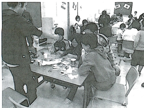
写真2 ゲルマニウムラジオコーナー