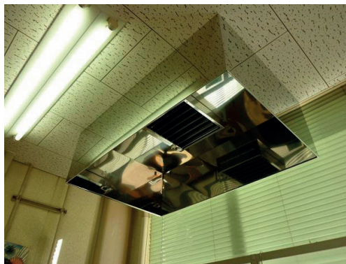
写真 - 7 天井ダクト

当初は家庭で使用する大きめのサイズの吸気と排気をする換気扇をそれぞれ1台ずつ設けた。しかし, 作業を行う場所の天井の高さは約2.5mであり, 予想外に大きな炎になった場合は天井に届いてしまう可能性があり, 改善を強いられた。そこで, 天井ダクトを作業台の真上に設置することにした(写真-7)。これにより作業場において上向きの流れを作ることができ, 安定した細い炎を維持することも可能となり, 且つ火災防止対策を施すことができた。