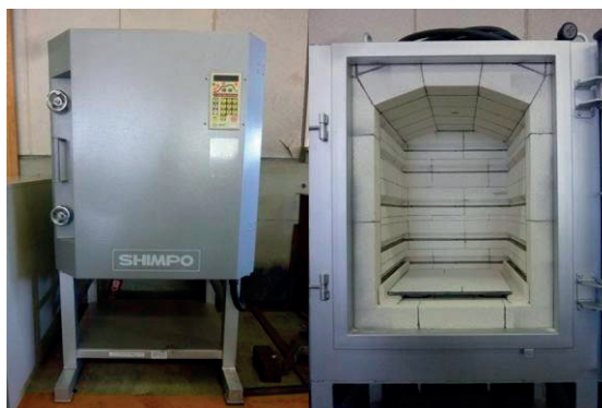
写真 - 5 電気窯

加工後のガラス製品の歪みを取り除くために、日本電産シンボ株式会社製のマイコン付小型電気窯(DFA-06)を設置した(写真-5)。大きい製品が入るように炉内の寸法は高さ520mm, 横420mm, 奥行き420mmと陶芸用の電気窯を設置した。また, 最高使用温度は1300℃である。