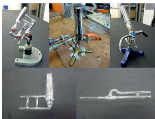
写真 - 2 ガスバーナー

ガスバーナーは標準管(パイレックス)用と石英用の2種類を揃えた。標準管(パイレックス)用は火口の大きさや使いやすさ、金銭面を考え、3種類のガスバーナーを揃えた(写真-2上)。取り揃えたバーナーは(有)光信理化学製作所製のKS-Nバーナー1台と細工用バーナー2台と木下理化工業株式会社製の木下式ブルーバーナー1台の3種類である。石英用は火口の大きさを考え、2種類のガスバーナーを揃えた(写真-2下)。取り揃えたバーナーはハンドタイプのバーナーである。