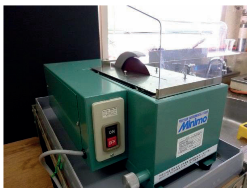
写真 - 3 卓上切断機

卓上切断機はミナター株式会社製の卓上切断機(WK-610)を設置した(写真-3)。切断する材料の大きさを考えダイヤモンド砥石のサイズを直径100mmと150mmの2種類用意した。