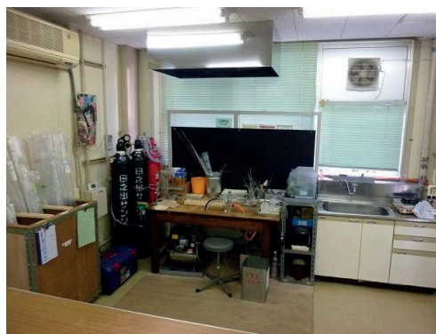
写真 - 1 ガラス加工室

まずガラス加工室の整備に取り掛かった。ガラス加工室は工学部内にあるものづくり教育実践センターの準備室の一角に設けることとなった。(写真-1)。以前は学生実習や講習会での説明、待機部屋として利用していたが、部屋を効率よく整備することでガラス加工を行える場所を確保することができた。