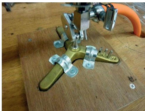
写真 - 6 バーナー固定枠

バーナーが転倒するのを防止するためにバーナーの固定枠を製作した(写真-6)。固定枠はコンパネを使用し, バーナーの台座の形にくり抜き, 作業台と固定した。そして, 留め金具を用いてバーナーと固定している。