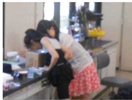
図 2-2 : 実験風景 段ボールと UV カットフィルムで作った電気泳動後ゲル撮影装置

予備知識がほとんどない生徒や本などで勉強するなどしてレベルの高い知識を有する生徒などがおり、生徒によってレベルがまちまちであった。余力のある生徒に対しては発展的な内容を教えるなど、個々に合わせた指導を行ったつもりであったが、難しいと感じたり、物足りないと感じる生徒がいた。この点は今後このような活動をする場合に考慮し、改善しなければならないと感じた。ただし、中学校レベルで扱いにくい題材に対して実験実習を行ったことで、多くの生徒の未知なる科学への不安を払拭し、興味を引き出した点は評価に値する活動と言えるだろう。