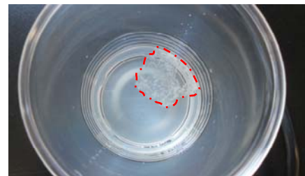
図 3 : ニンニク DNA (赤枠内)