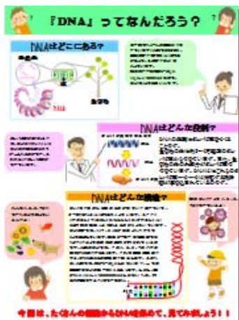
図1：用いた資料（一部）

本研究では、科学を身近に感じさせることと大学で行うことの利点を活かした発展的内容であることに重点を置いた。そこで今回は、日常よく耳にするが、初・中等教育の中でほとんど触れられることがないという点で最も興味を引く科学分野の一つであり、発展的・先端的な内容を含む「DNA」を題材に実験を行った。DNA実験は、上述のような理由により、初・中等教育レベルで殆ど行われず、漠然としたイメージしか持たない生徒が多い。そのため、大学の技術および設備を活用する科学啓発活動として最適な題材であると考えられる。