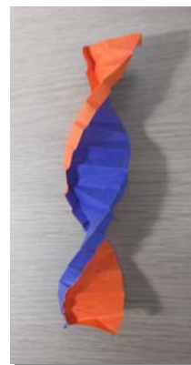
図 4 : 折り紙による DNA のモデリング