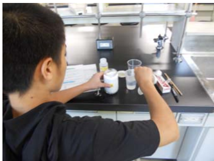
図 2：実験風景 洗剤、塩、計量スプーン等の生活用品を使って実験を行った

人の DNA（本人の同意確認済み）だけでなく、植物の DNA も抽出させ、比較・考察させた。このとき、すりつぶす手間を省くため、市販の国産および外国産のすりおろしにんにくを使用した。