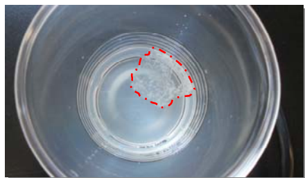
図 4：にんにく DNA（赤枠内）