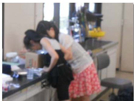
図 3：実験風景 段ボールと UV カットフィルムで作った電気泳動後ゲル撮影装置