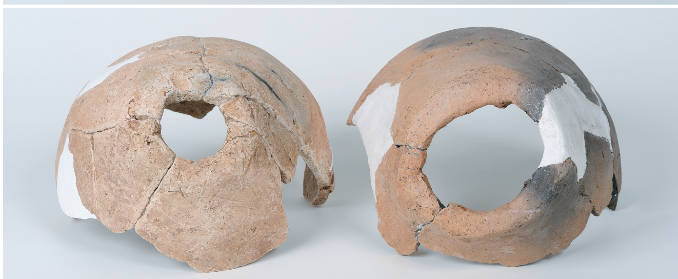
壺形埴輪 (2) (胴部から底部)