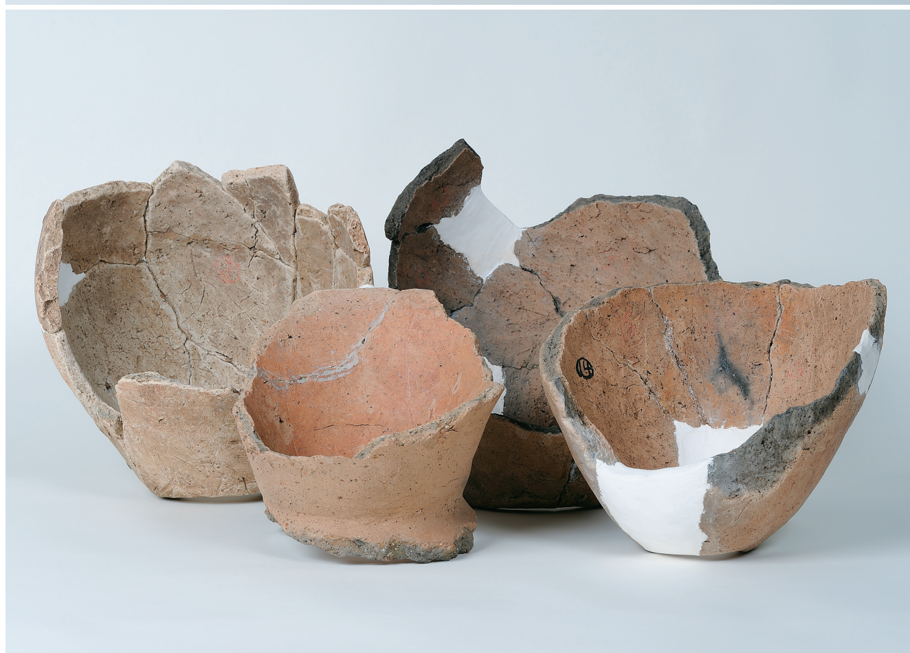
壺形埴輪 (1) (口縁部・胴部から底部)