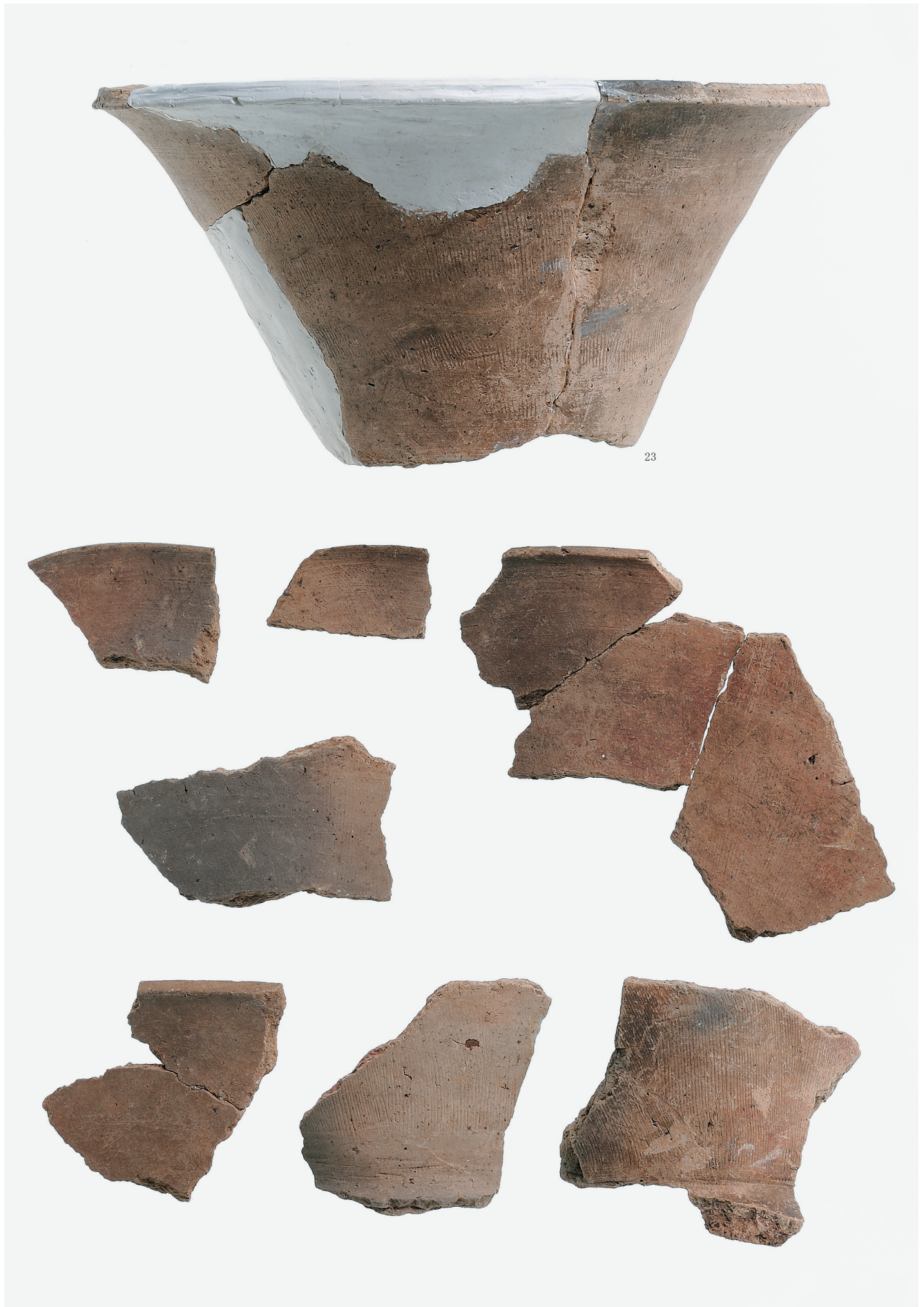
壺形埴輪 (3) (単口縁 1)