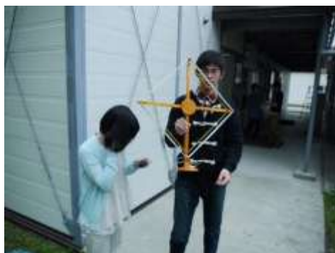
写真1 ゲルマニウムラジオによる受信 第2回に電池のいらぬラジオを作り、屋外で受信実験を行った。アンテナの向きによって音量が異なることを体験した。