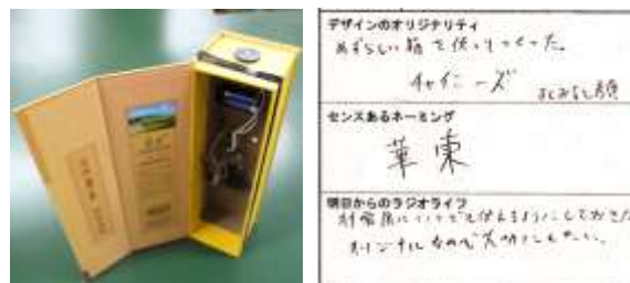
写真4 作品例とプレゼンテーションメモ 自由に選んだケースにアンテナコイル、バリコン、基板、スピーカー、電池ボックス、スイッチを取り付けて完成し、最後にラジオに名前を付けた。