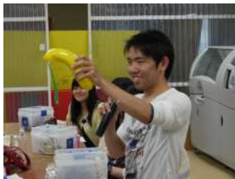
写真3 プレゼンテーション風景 最終回の授業で、各自がどのような考え方でラジオの外観を設計したかについて、プレゼンテーションを行った。