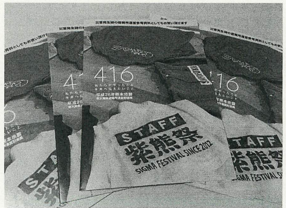
『416——私たちがやったこと 未来へ伝えたいこと 平成28年熊本地震 熊大黒髪避難所運営記録集』

避難所として開設をするのか否か、16日未明の体育館にはまだ情報がなかった。朝になって「地域の復興優先」という言葉が伝えられ、避難所運営の体制を整えていったのである。この時点で、体育館には約120名の学生がボランティアとして運営に携わっていた。本部と支援物資置き場、受付はあったものの、いつまで続くかわからない避難所運営の長期戦に備えて、仕事内容の明確化を図った。本部、受付、救護、外国人対応、情報、環境、警備、物資配給の8つの機能を立ち上げ、各リーダーはシフトを組んだ。こうした学生たち主体による避難所運営は4月18日正午に解散し、19日以降は、学内に残った学生、体育館で避難生活をしている被災者に引き継がれた。18日までの学生主体の避難所運営が、その