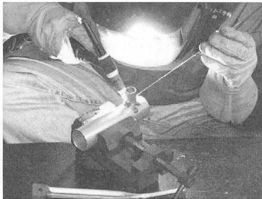
図2 溶加棒を使った溶接風景

両手別々の作業をすることで気はやはり注意力が散漫することが原因であったため、落ち着いて注意深く観察しながら行うことを助言した。