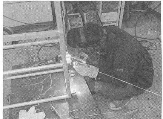
図3 フレーム製作風景

歴代のソーラーカーよりもさらに、強度を保ちながら軽量化を図ることと、空気抵抗の小さいデザインにすることが大事で、今までは製作日数の問題で溶接が容易な角パイプを使用していた。今回製作する4号機ではそれを丸パイプに変更することで、フレーム強度はそのままに軽量化を図る。これを可能にするためには自己流の溶接ではなく技術職員による溶接講習を受け技術力をあげたいとの意識のもと、積極的に取り組んでいるようだった。丸パイプの溶接は角パイプと違い平面部がなくトーチの高さを変えながら母材との距離を一定に保つため数段難しく、学生も悪戦苦闘しながら、粘り強く製作を続けついに完成を迎えることができた。