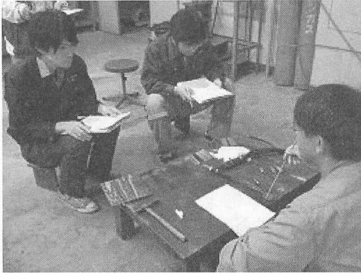
図1 TIG 溶接技術概要の風景

その他に、溶接距離が長くなると集中力がなくなり溶融池を見逃しがちになるため、短い距離の溶接から段階的に伸ばしていった。