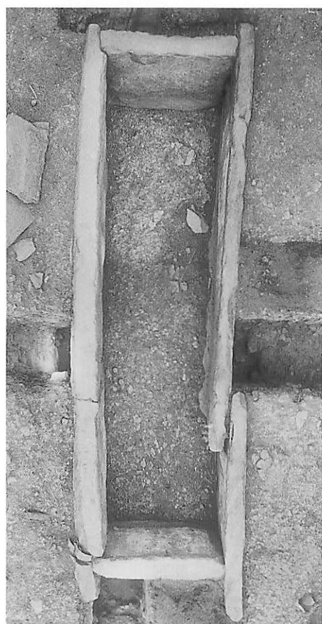
3 10号墳棺身全景（上が北）