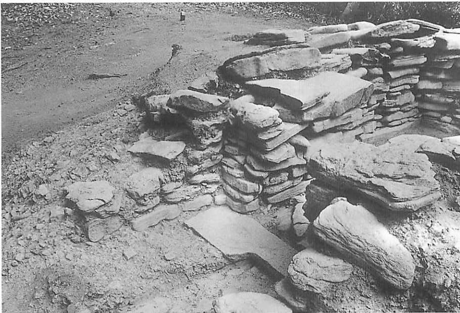
2 5号墳前庭部左側壁 （南東から）