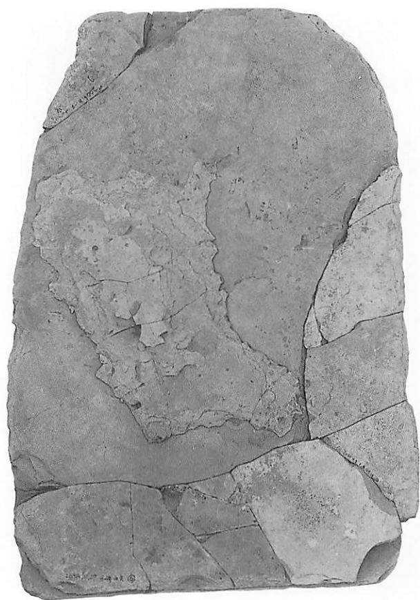
1 10号墳北側蓋石（接合後、表面）