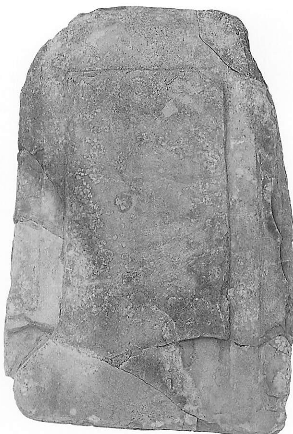
2 10号墳北側蓋石（接合後、裏面）