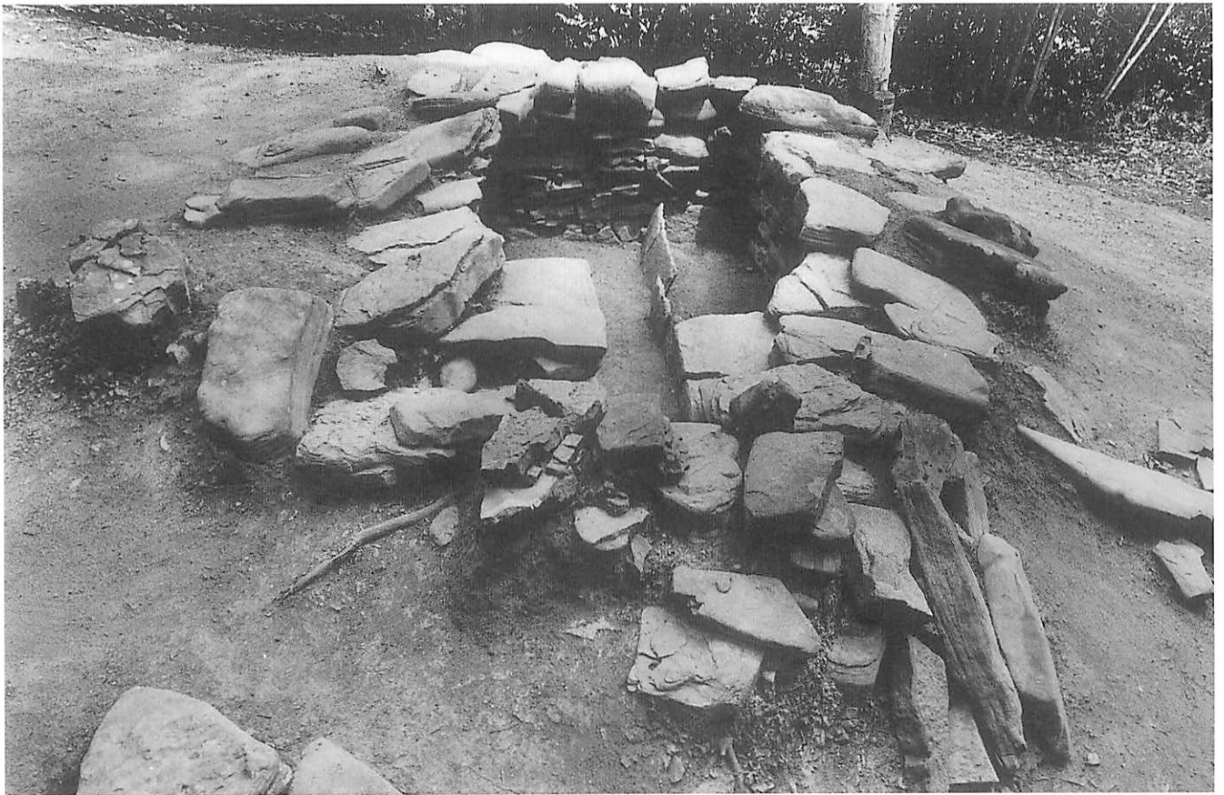
2 5号墳石室全景（前庭部調査前、南から）