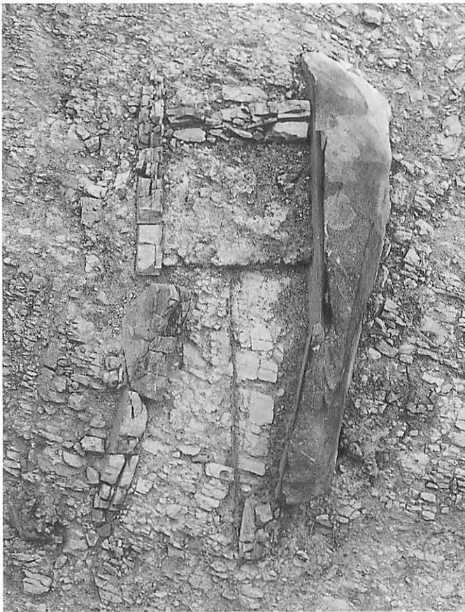
2 25号墳棺身全景（上が東）