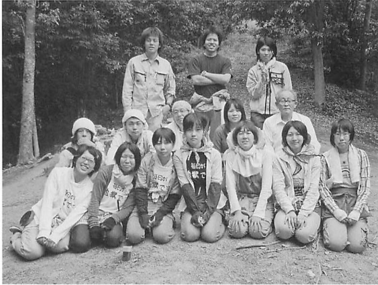
調査参加者集合写真（千崎5号墳前にて）