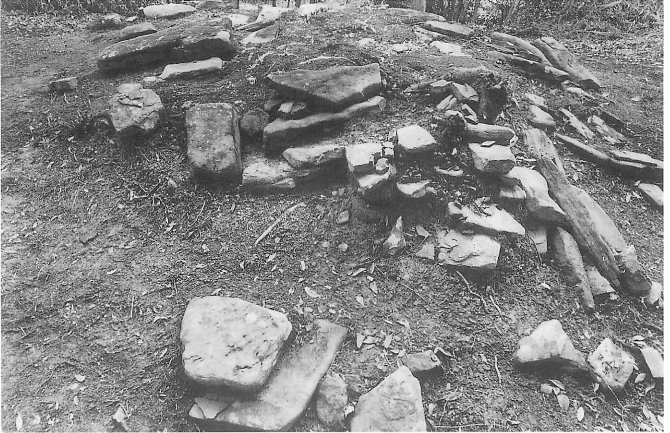
1 5号墳石室南側（調査前、南から）