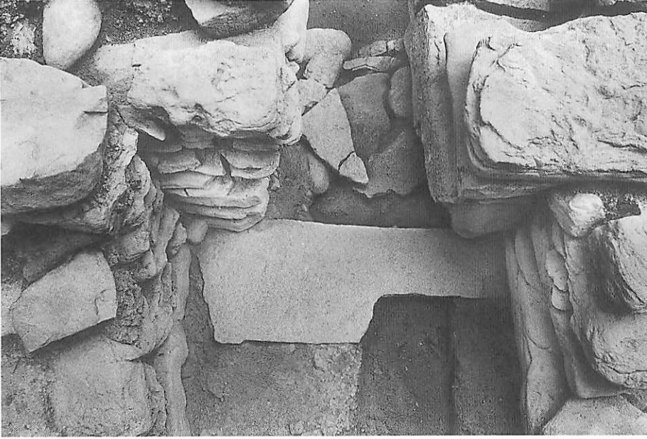
1 5号墳羨門床石（上が北）