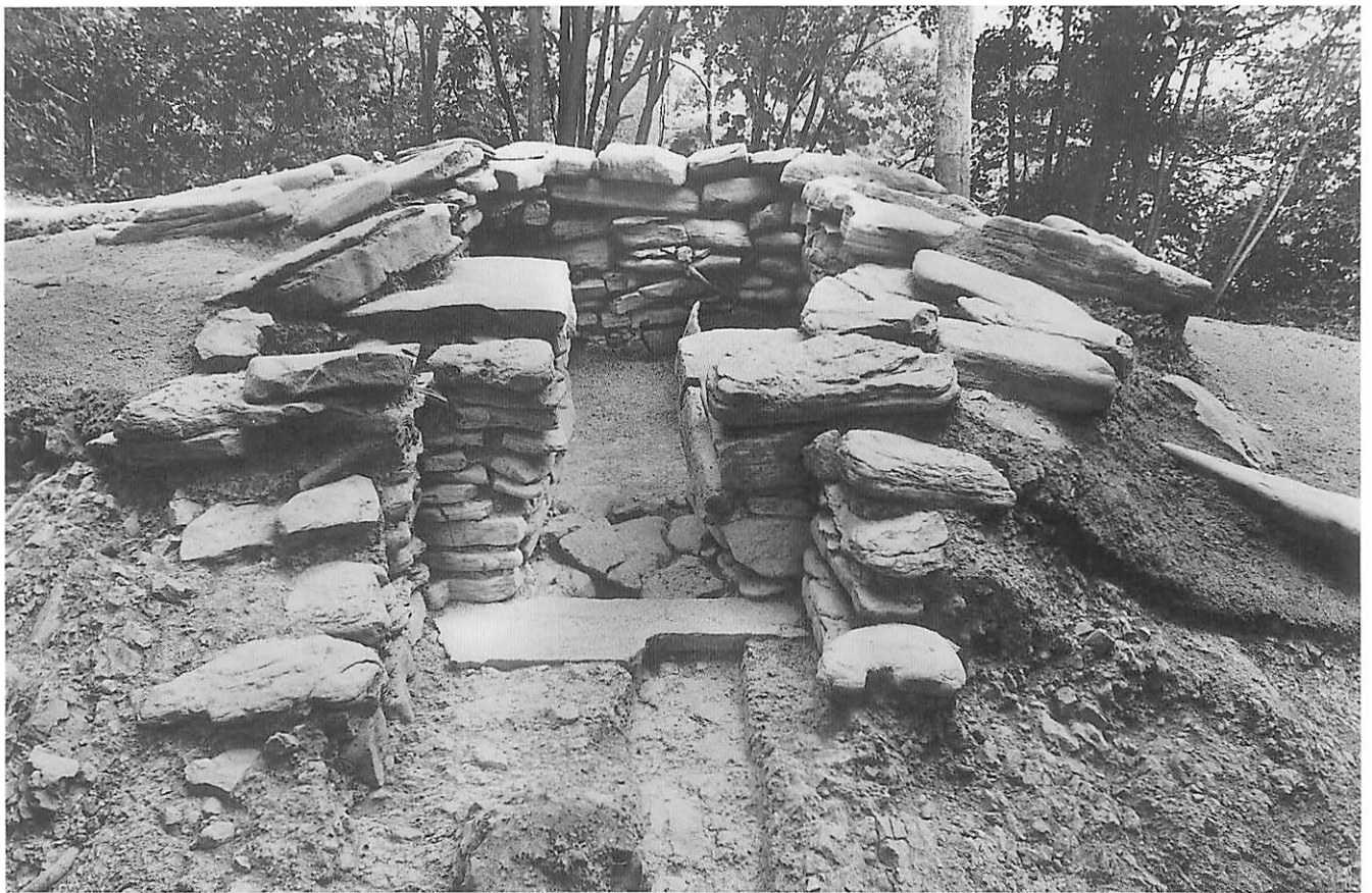
2 5号墳前庭部（閉塞石取り上げ後、南から）