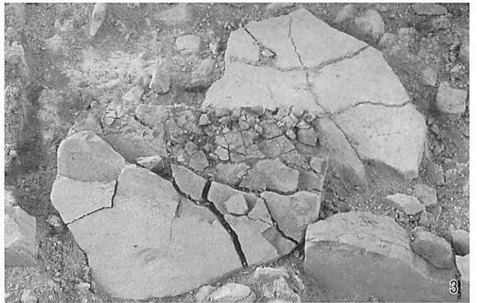
3 25号墳棺内西側出土石材検出状況（北から）