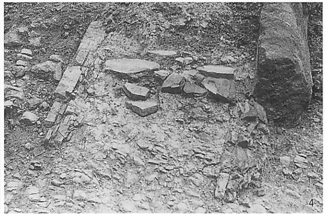
4 25号墳西小口石材検出状況（西から）