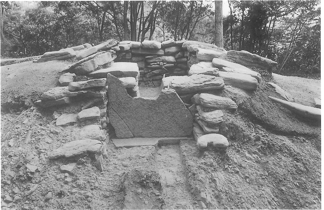
1 5号墳前庭部（閉塞石取り上げ前、南から）