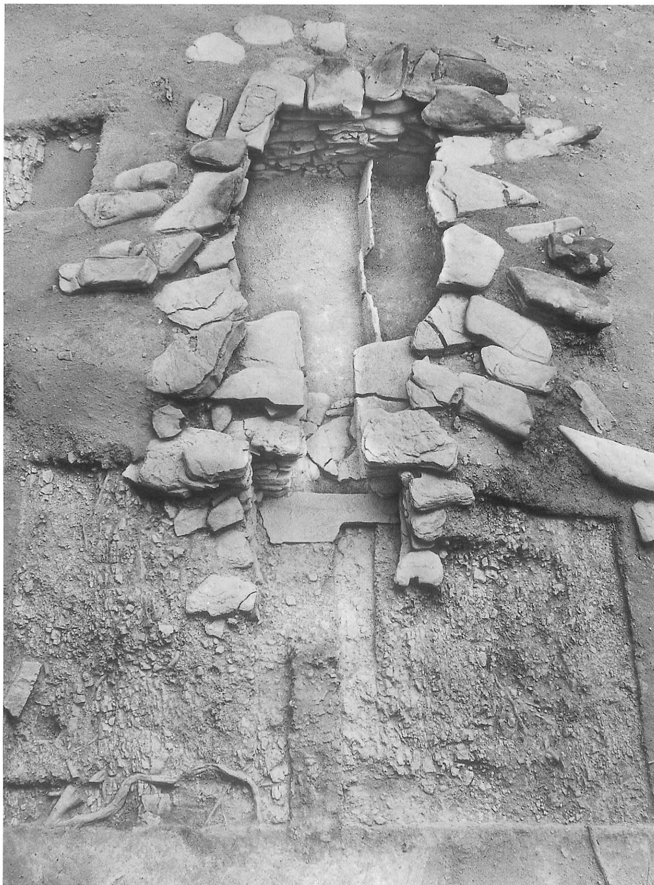
5号墳石室全景（南から）