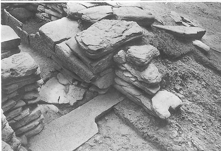
3 5号墳前庭部右側壁 （南西から）