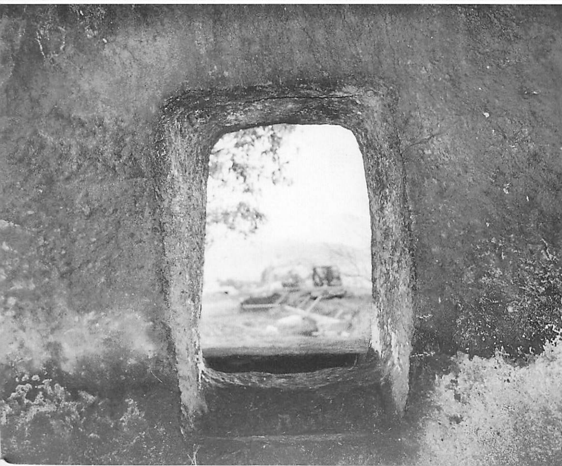
鬼ノ釜古墳 割抜玄門 (石室内より)