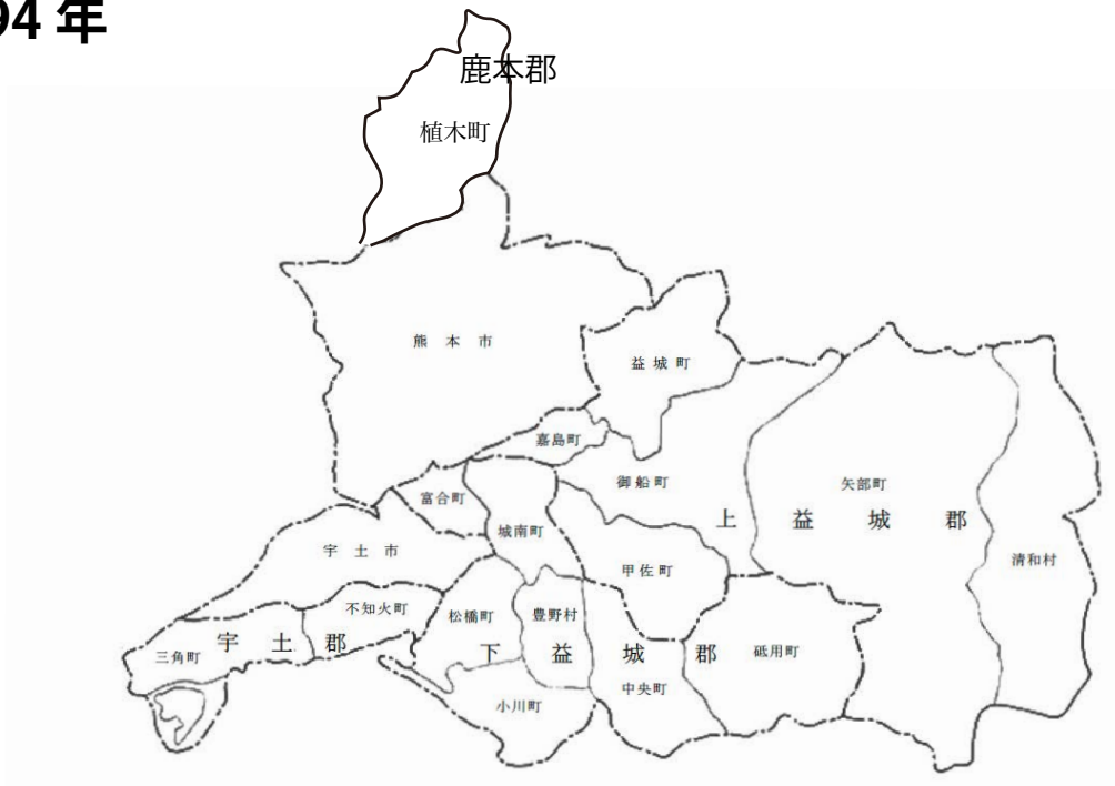
平成6年4月1日現在の市町村図