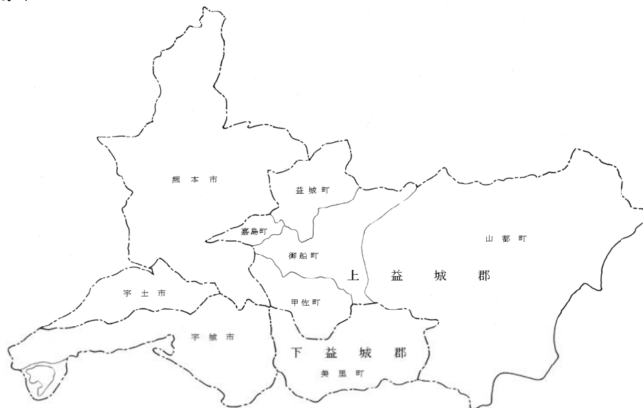
平成22年4月1日現在の市町村図