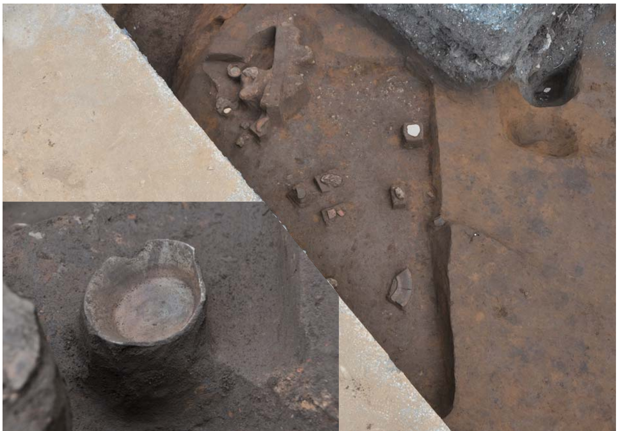
3. 本荘北地区 1321 調査地点 20 区で検出した竪穴建物と遺物