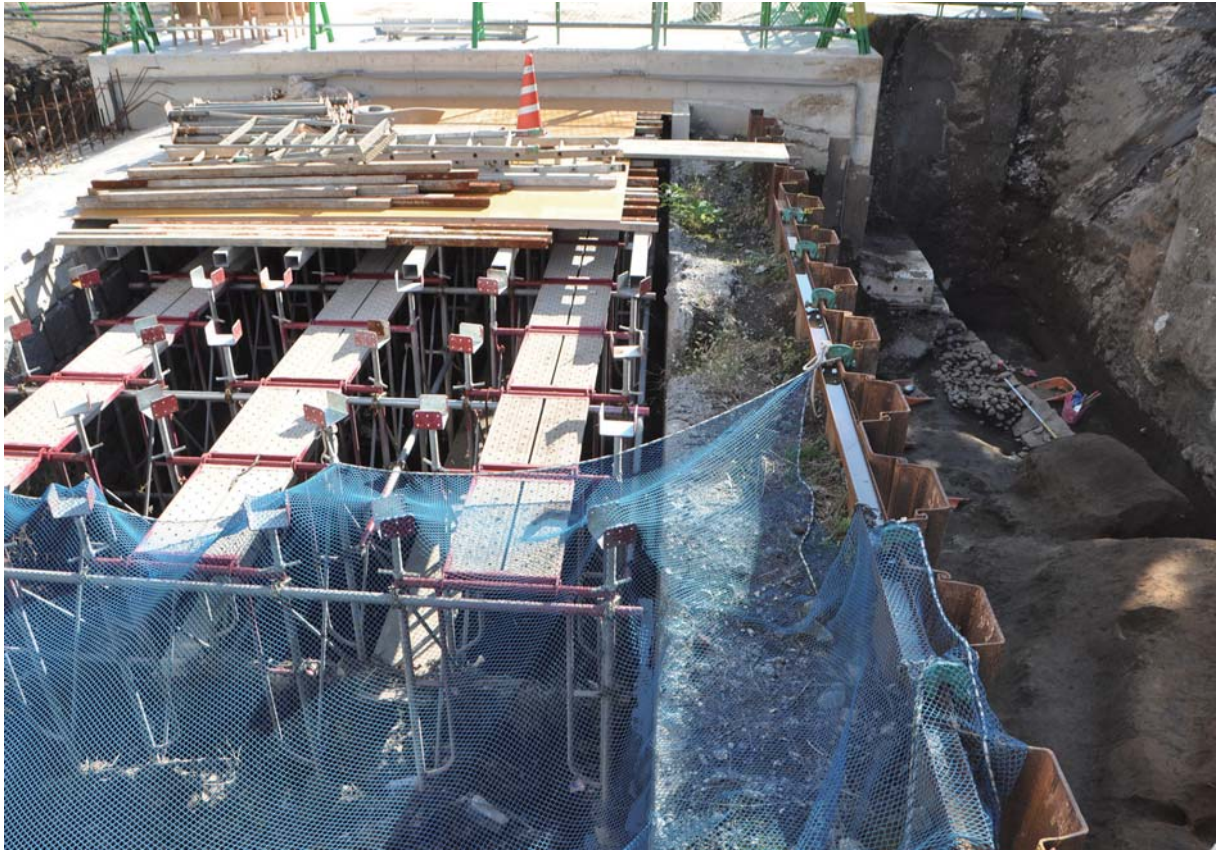
2. 改修工事中の現三の井手と発掘調査中の旧三の井手