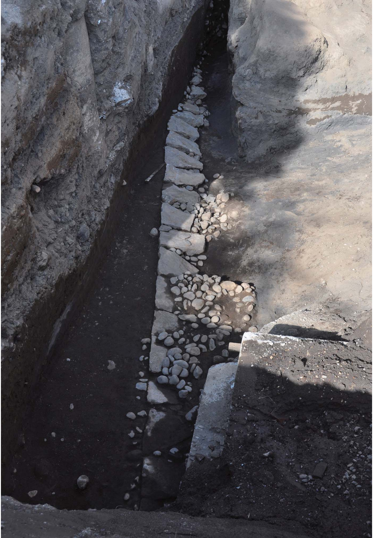
1. 本荘北地区 1321 調査地点 30 区で検出した井手遺構